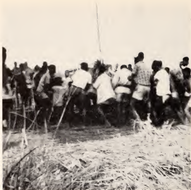
Fig. 34 — Mungonge . Os áfu beliscando os miári