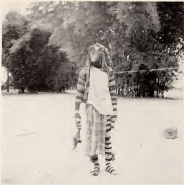
Fig. 10 — Mukichi uá ngúlu ( Mukichi de porco )