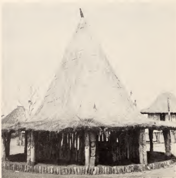
Fig. 3 — Tchiota . Típica construção da aldeia indígena do Museu do Dundo