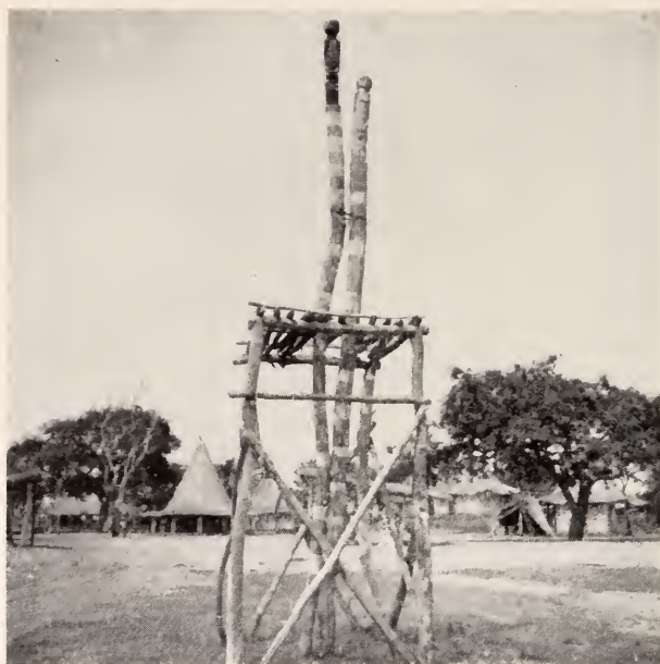
Fig. 26 — Súku . Hamba de geração