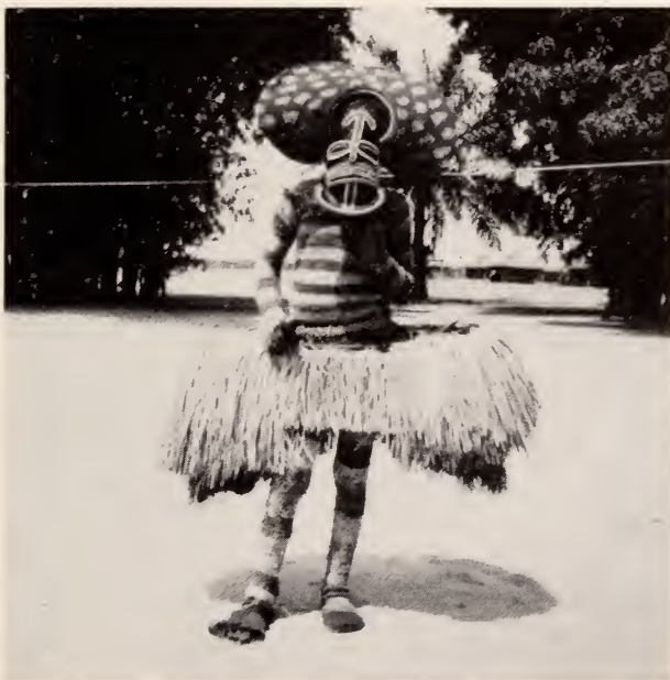
Fig. 9 — Mukichi uá tchuhôngu