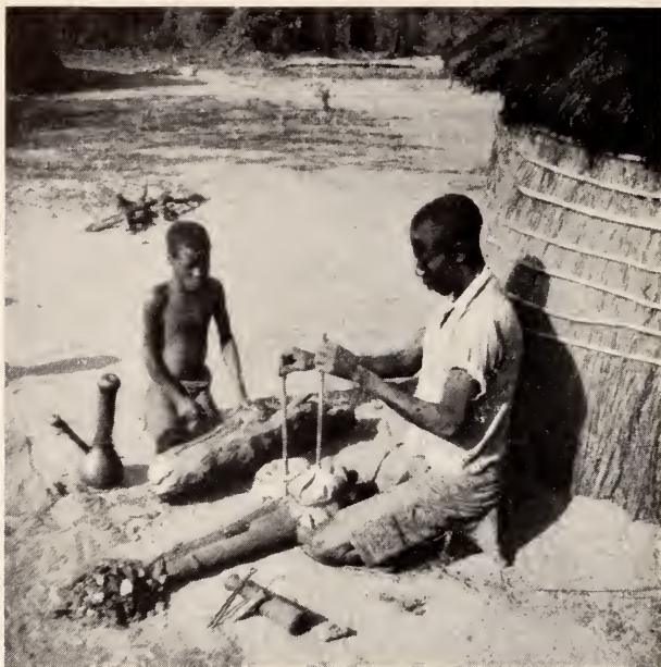
Fig. 2 — O ferreiro com o seu fole