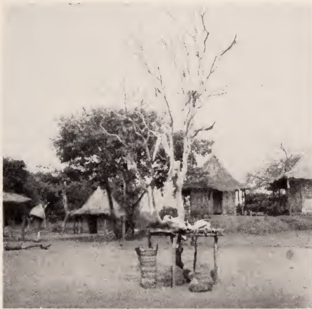
Fig. 17 — Trofeus dum caçador