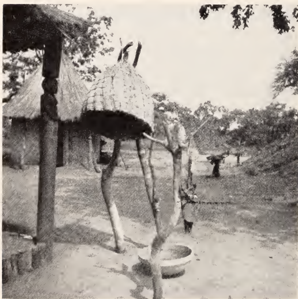
Fig. 19 — Mahamba de caça