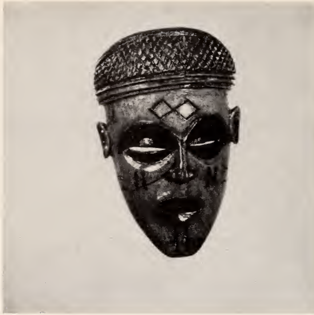
Fig. 14 — Caraça de mukichi uá puó