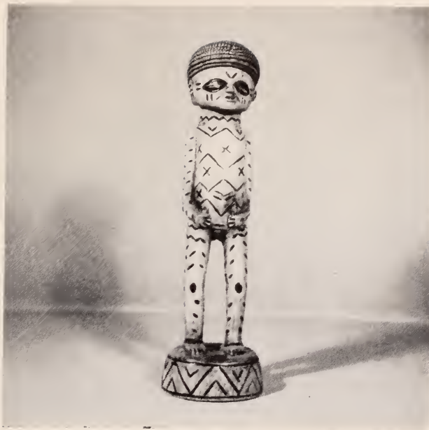
Fig. 12 — Escultura de mukichi uá puó