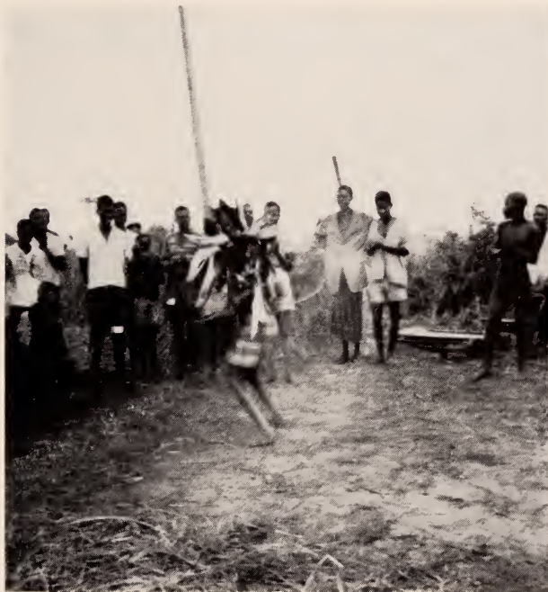
Fig. 37 — Mungonge . Um muári dançando