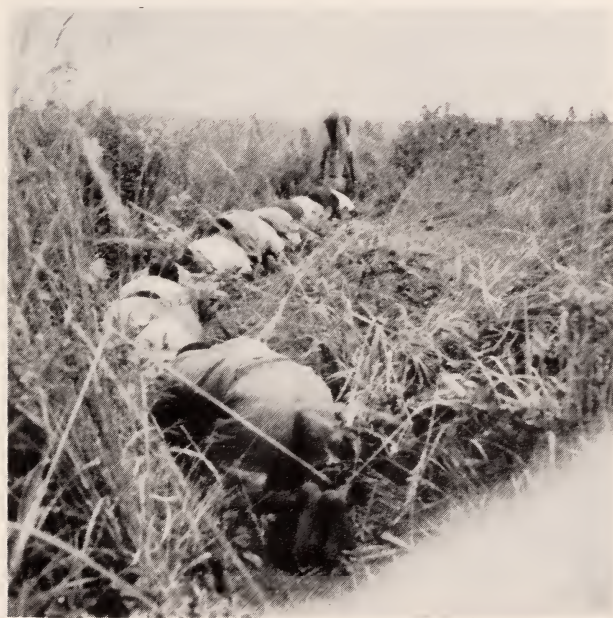
Fig. 33 — Mungonge . Os áfu arrastando-se no capim