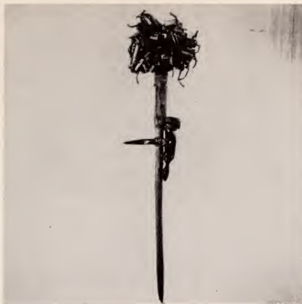
Fig. 20 — Tchisola . Hamba de geração