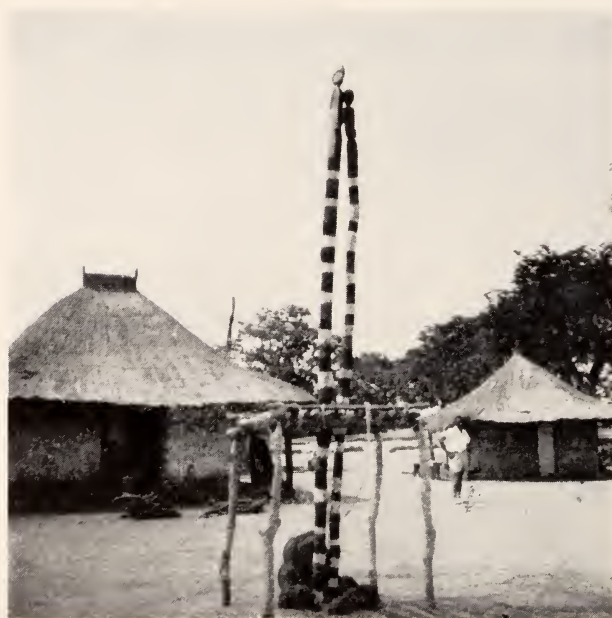
Fig. 27 — Súku . Hamba de geração