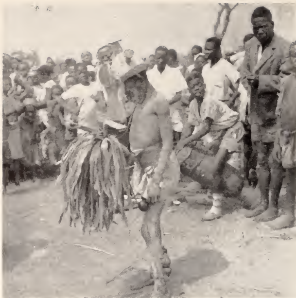
Fig. 6 — Circuncisão. Um kandanje aguardando a sua vez da dança