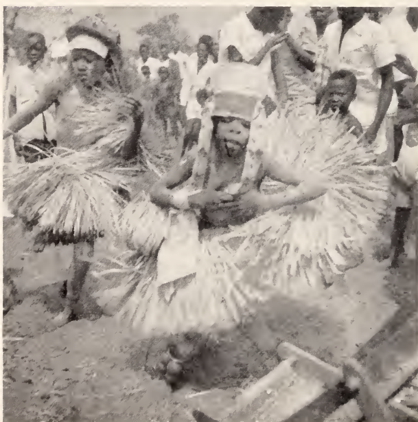
Fig. 7 — Circuncisão. Tundanje dançando