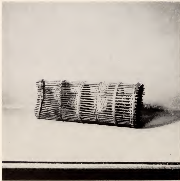
Fig. 15 — Múchu . Armadilha de pesca