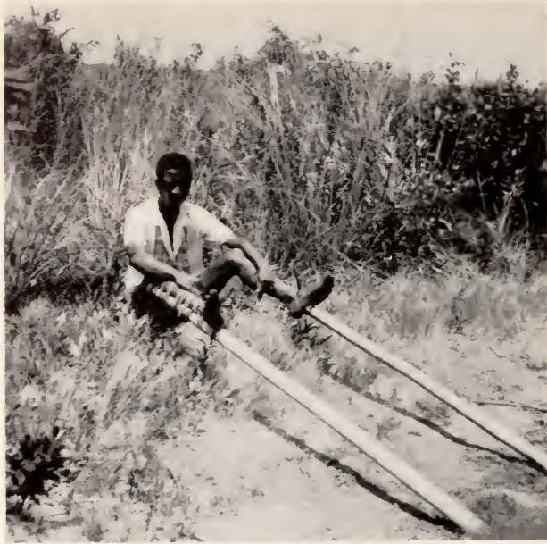
Fig. 30 — Mungonge . Um muinda mostrando as andas