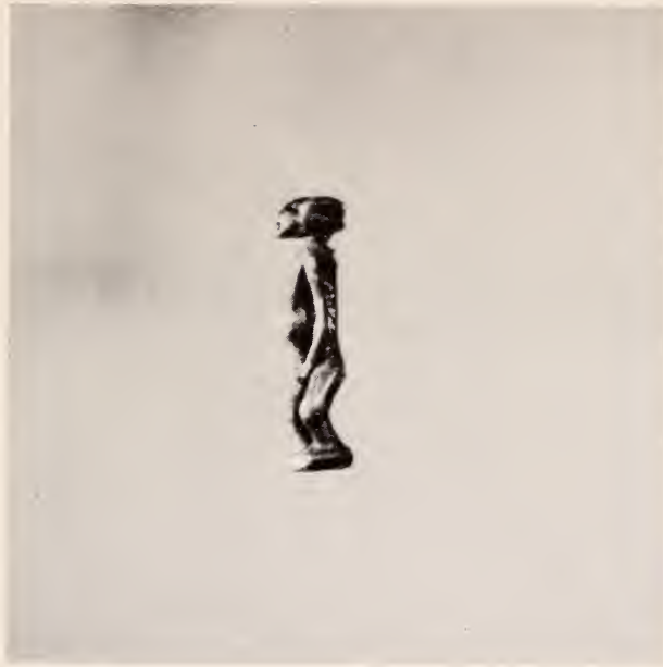
Fig. 28 — Mulher grávida. Peça de adivinhação