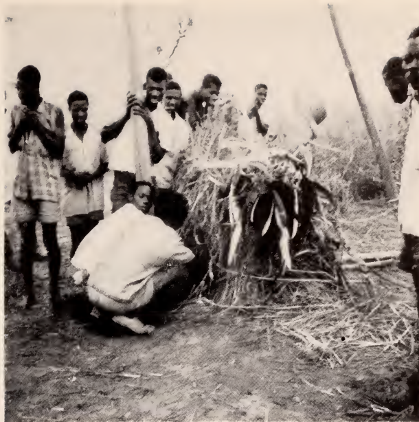
Fig. 36 — Mungonge . Um muári com a mão presa na abertura da maila