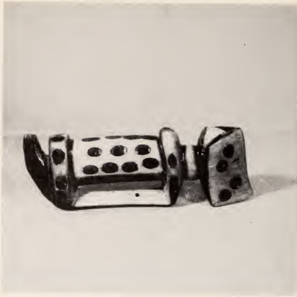
Fig. 22 — Muta (cão). Hamba de geração e caça