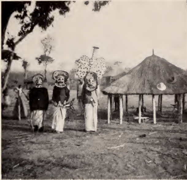
Fig. 4 — Circuncisão. Os akichi