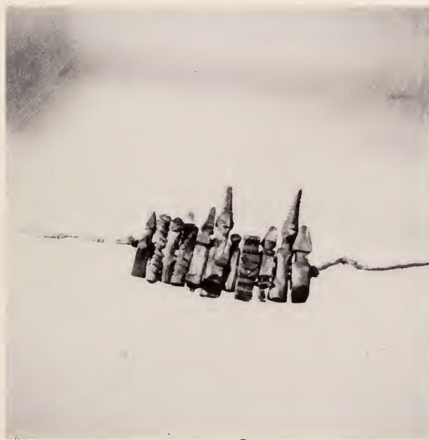
Fig. 21 — Mahamba à muia . Mahamba de geração