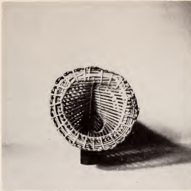
Fig. 16 — Mutchu . Armadilha de pesca. (Base)