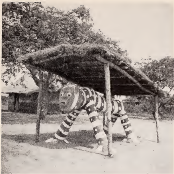
Fig. 24 — Tâmbue . Hamba de geração