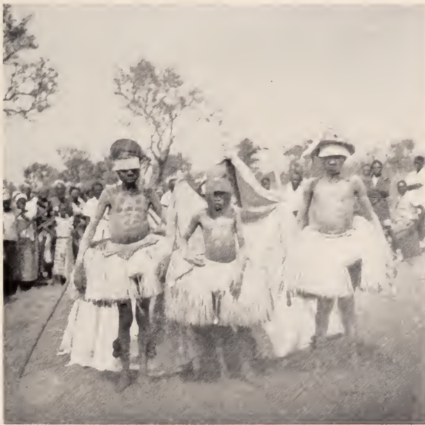
Fig. 5 — Circuncisão. Três tundanje