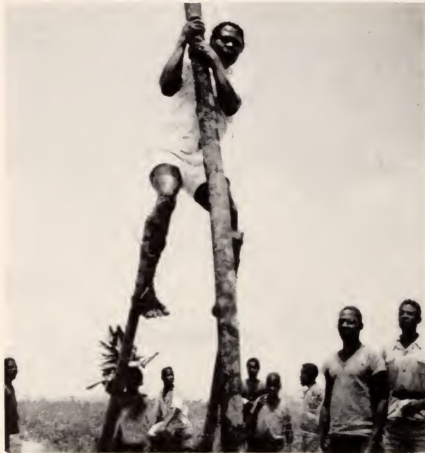
Fig. 31 — Mungonge . Um muinda subindo ao poste para se «pôr de pé»