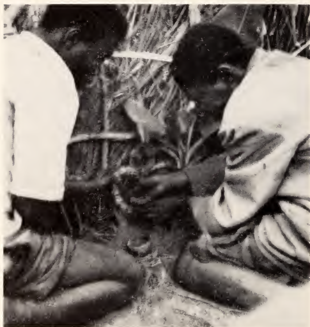
Fig. 35 — Mungonge . O samazemba oferencedo a haste de capim com pirão