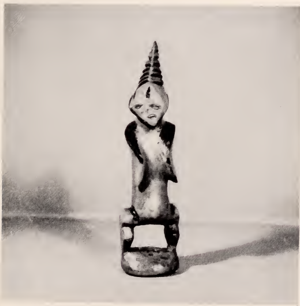
Fig. 13 — Escultura de mukichi uá tchikunza