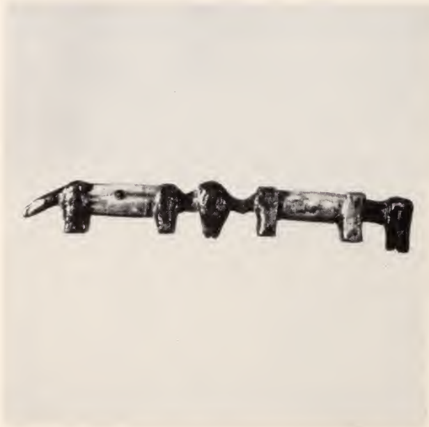
Fig. 23 — Tua (cães). Hamba de geração e caça