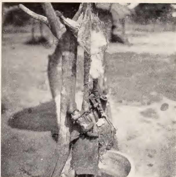
Fig. 18 — Mahamba do caçador