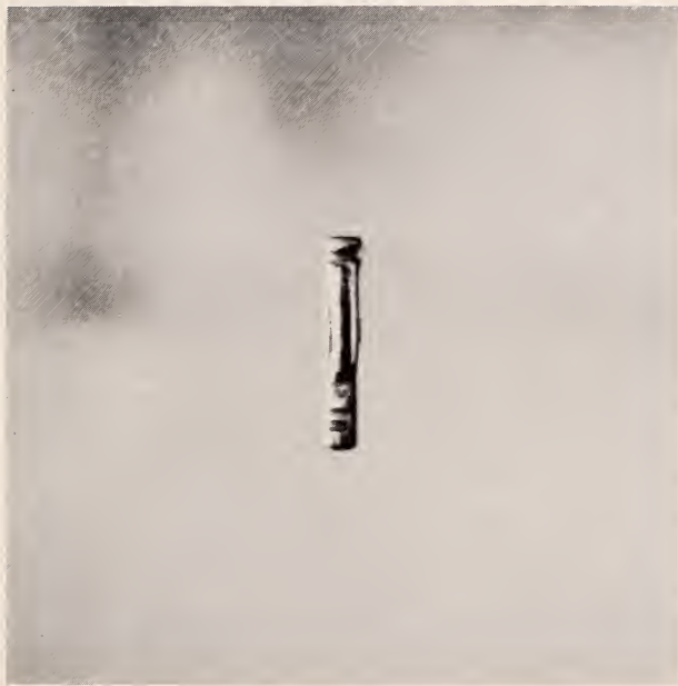
Fig. 29 — Nganga . Peça de adivinhação