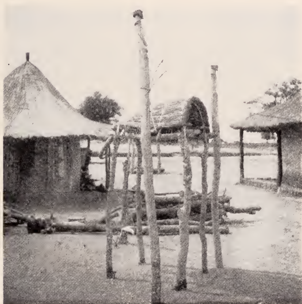
Fig. 25 — Mahamba de geração