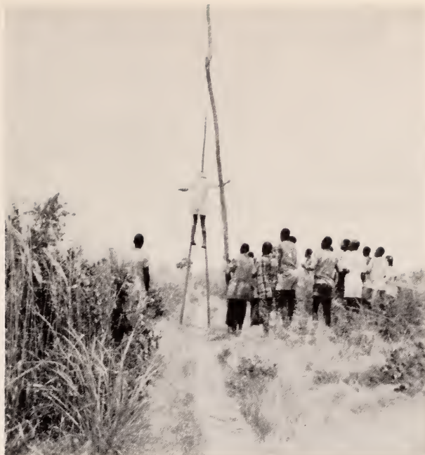
Fig. 32 — Mungonge . Um muinda passeando o zemba