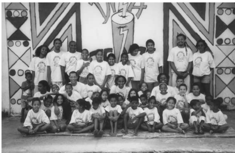
Participantes do Projeto Batukerê em frente à quadra do Grupo Cultural Dilazenze (2000).

Em 1986, alguns jovens da nossa família decidiram fundar um bloco afro que tivesse uma ligação com o terreiro, o Grupo Cultural Dilazenze – um bloco que recebesse do terreiro a influência da dança, da música, do toque... Desde o início, o Dilazenze tem o fundamento do próprio terreiro. Todos os fundadores dele receberam obrigações, foram preparados para isso. Eu estou no Dilazenze há vinte e quatro anos! No tempo em que o terreiro não podia fazer suas festas públicas, o Dilazenze foi muito importante para preservar nossas tradições e nossa memória. Mas não precisa ser do terreiro para alguém participar do Dilazenze: basta a pessoa ter vontade de participar. No início, eu enfrentei alguma resistência de alguns dos mais velhos do terreiro, que não aceitavam a ideia de um conjunto de dança ligado ao terreiro. Mas, aos poucos, fomos conseguindo conquistar a compreensão e o respeito desses mais velhos e de todos pelo que nós fomos fazendo na área social e cultural.