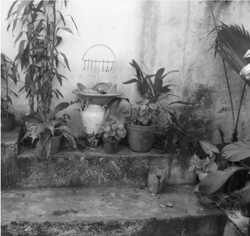
Assentamento de Ogum.