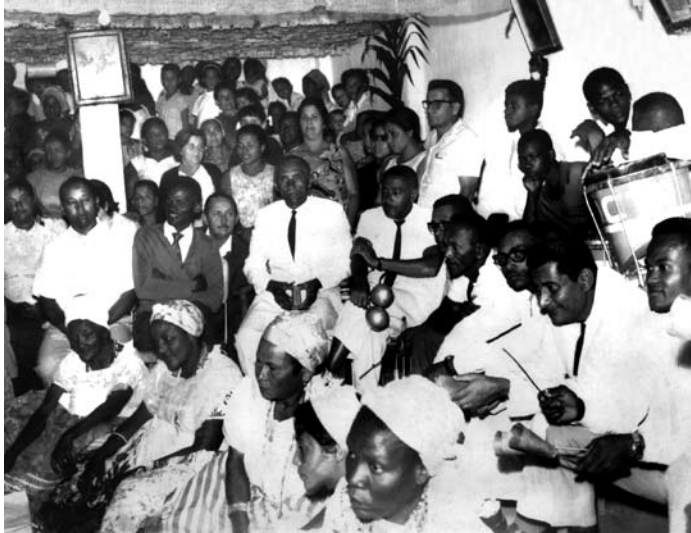
Festa de Zumbarandanda (segundo dia, década de 1960).