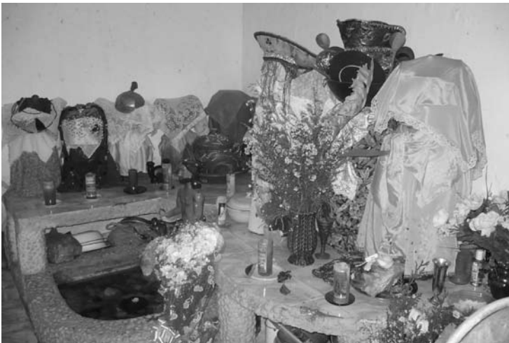
Assentamentos de Dandalunda, Matamba e Zumbarandanda.

Quer dizer, essas coisas acontecem sim, as pessoas veem!