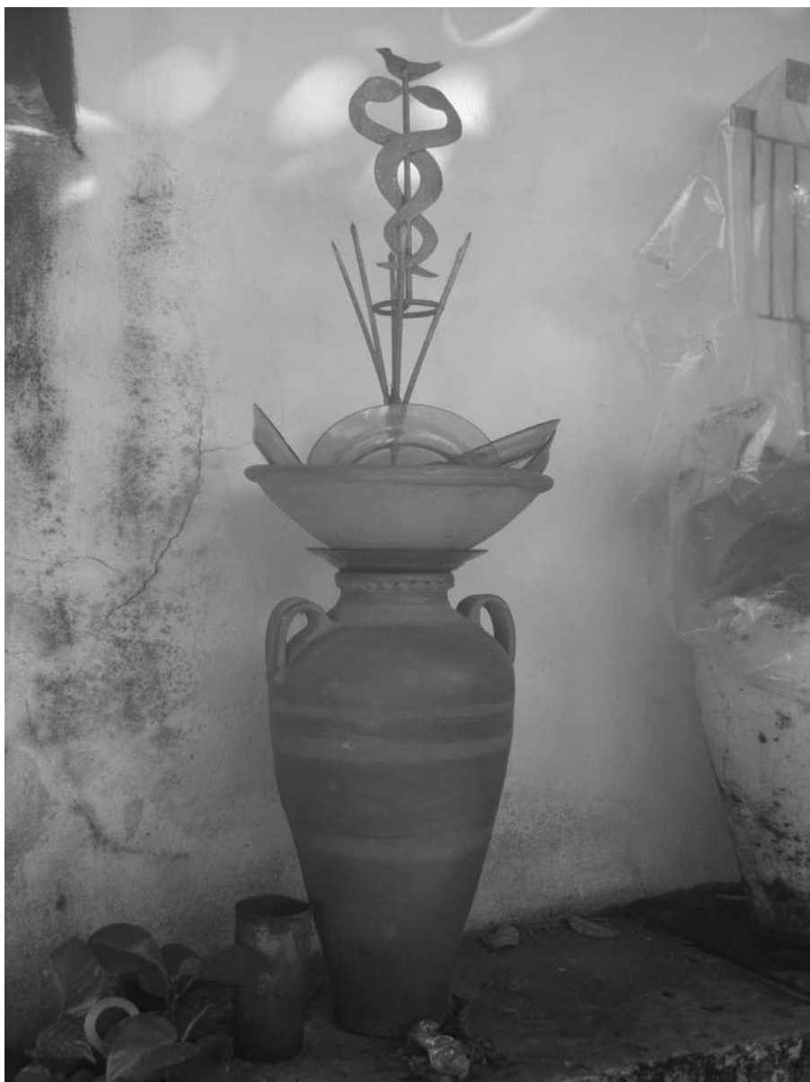
Assentamento de Angorô.