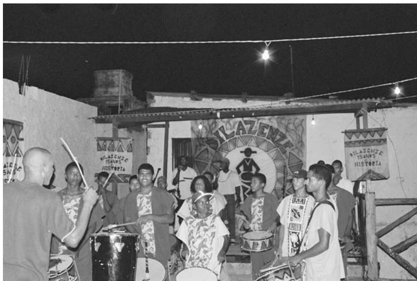
Grupo Cultural Dilazenze ensaiando em sua quadra (2003).