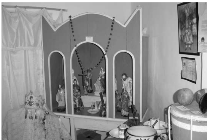
Interior da capelinha de Nossa Senhora de Sant'Ana (hoje Memorial Matamba Tombenci Neto).

gente desde a porta do Hospital Regional, que fica a uns 500m, até aqui. O dia todo, a noite toda, tinha gente de todo tipo; todo mundo fez questão de vir e passar a noite aqui. De uma ponta a outra, era gente nessas calçadas. Isso aqui ficou lotado de gente e de carro. E no outro dia, no enterro dela, foi uma coisa que também chamou a atenção. O comércio fechou e o pessoal chegou a fazer dano dentro do cemitério, porque todo mundo queria assistir. Pulavam por cima do muro, saíam pisando por cima das covas, danificaram muitas covas, muitas esculturas. Já não tinha mais onde caber gente. A fila de carros que se formou no caminho do terreiro para o cemitério era gigantesca. Contam que, quando os primeiros carros estavam chegando lá, ainda havia carros saindo daqui. Porque todo mundo queria ver. Foi um acontecimento e foi uma perda irreparável.