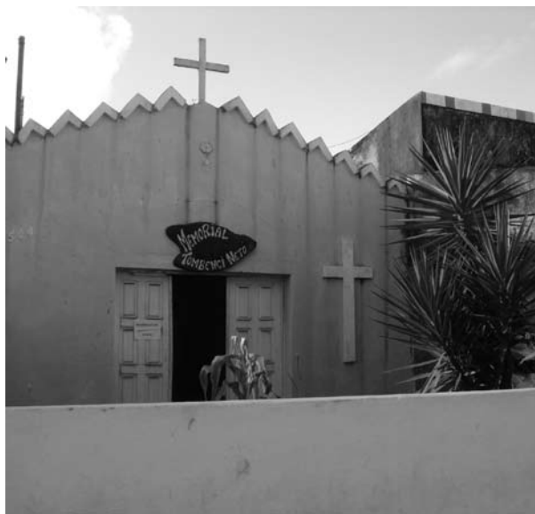
Capelinha de Nossa Senhora de Sant’Ana (hoje Memorial Matamba Tombenci Neto).

– Olha, eu estou chamando vocês pra dizer que eu fiz essa capelinha de Nossa Senhora de Sant’Ana e quero que vocês nunca desfaçam. Porque eu fiz isso aqui com muito amor, muito carinho, muita dedicação. Eu quero que fique aqui pros filhos, netos e bisnetos zelarem e não quero que desfaça de jeito nenhum.