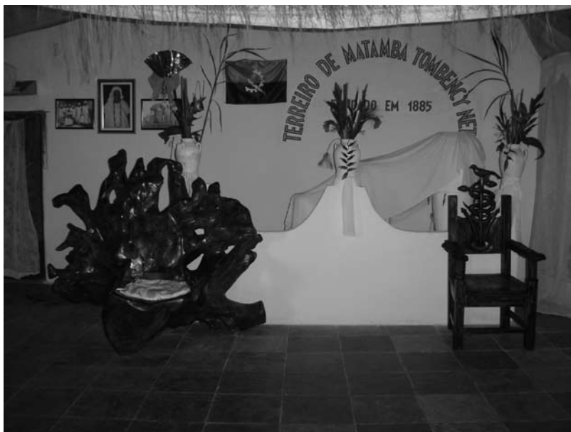
Trono de Dona Hilsa, à esquerda; à direita, cadeira de Angorô.