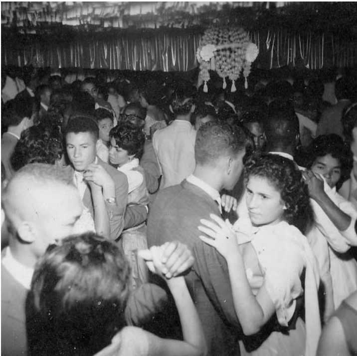
Baile da festa de aniversário de Dona Roxa.

Depois de sete anos de falecimento de mãe, a santa dela me pegou e eu fiquei recebendo ela todo ano, no dia da festa. O Mutalambô dela também passa por mim, porque eu sou de Matamba com Inkôssi, mas tenho esse Mutalambô de herança. É por isso que faço essa festa e faço questão de dar o máximo: o que posso fazer para deixar tudo arrumadinho, tudo bonitinho, eu faço. Quando eu vejo tudo arrumadinho, fico feliz. Porque os inquices que ela deixou, por incrível que pareça, até hoje eu nunca troquei o lugar de nenhum. Só tiro para fazer o ossé , a limpeza, e depois coloco no mesmo lugar.