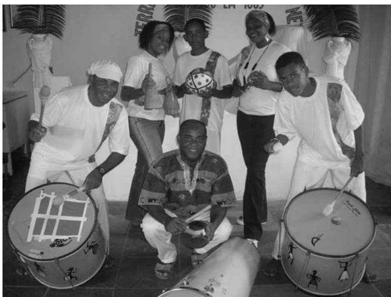
Banda percussiva da Organização Gongombira de Cultura e Cidadania (2008).

Da época da minha avó até hoje, e mesmo da época em que eu comeci a dirigir o terreiro até agora, mudou muita coisa no mundo. E no candomblé também. Às vezes, o candomblé parece estar virando comércio. Mas também tem gente trabalhando pela preservação dos valores, da tradição, da religião. É preciso promover o encontro das pessoas de candomblé, dos filhos de santo, para a gente esclarecer. Assim, quando acontecerem debates, seminários, as pessoas podem participar de cabeça erguida. Não precisam ficar escondidas pelos cantos, com vergonha de falar na frente de pessoas formadas. Porque formatura em colégio nunca deu o saber do candomblé a ninguém.