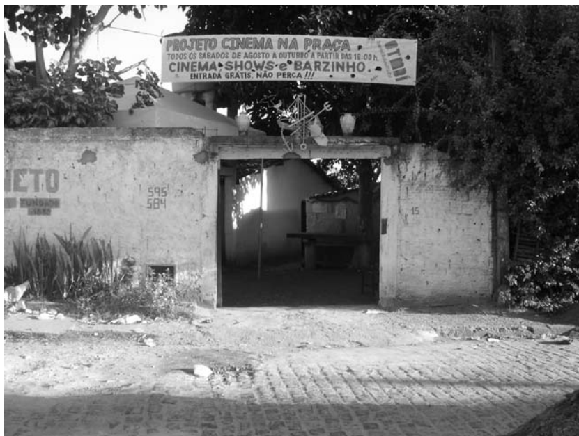
Terreiro Matamba Tombenci Neto hoje.