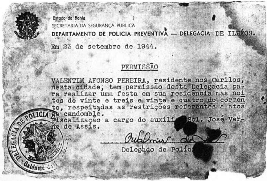
Licença da polícia para a realização de festa de candomblé (1944).