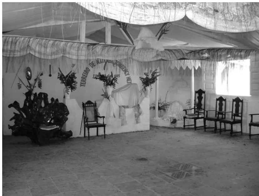
O barracão do Terreiro de Matamba Tombenci Neto em 2010

Depois disso, já tirei mais uns seis barcos e temos muita gente suspensa, esperando a confirmação para tatas e macotas , e também muita gente para ser raspada. Quer dizer, o terreiro continua! Muita gente chega aqui e quando vê, agora, tudo arrumadinho, pensa que não tivemos que fazer nenhum sacrifício. Mas a gente fez e faz muitos sacrifícios para manter esse terreiro. Foi muito sacrifício para poder levar adiante uma coisa assim de tantos anos, de hierarquia, uma coisa que a gente quer guardar, onde a gente quer cultivar os preceitos... Pode haver algumas inovações porque hoje a coisa não é mais como era e as coisas estão mais modernas. Mas a tradição, o essencial, a gente nunca perde. Porque são as pessoas que se submetem a isso que vão dar continuidade ao Terreiro Tombenci Neto.