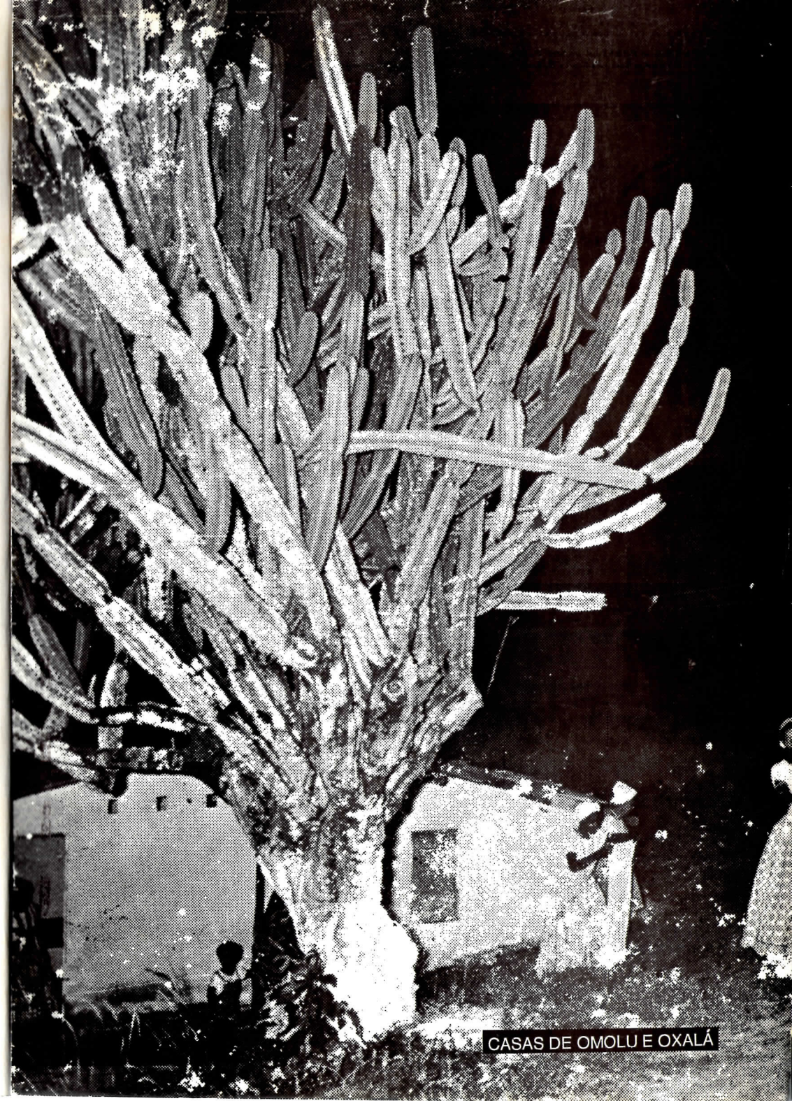
CASAS DE OMOLU E OXALÁ