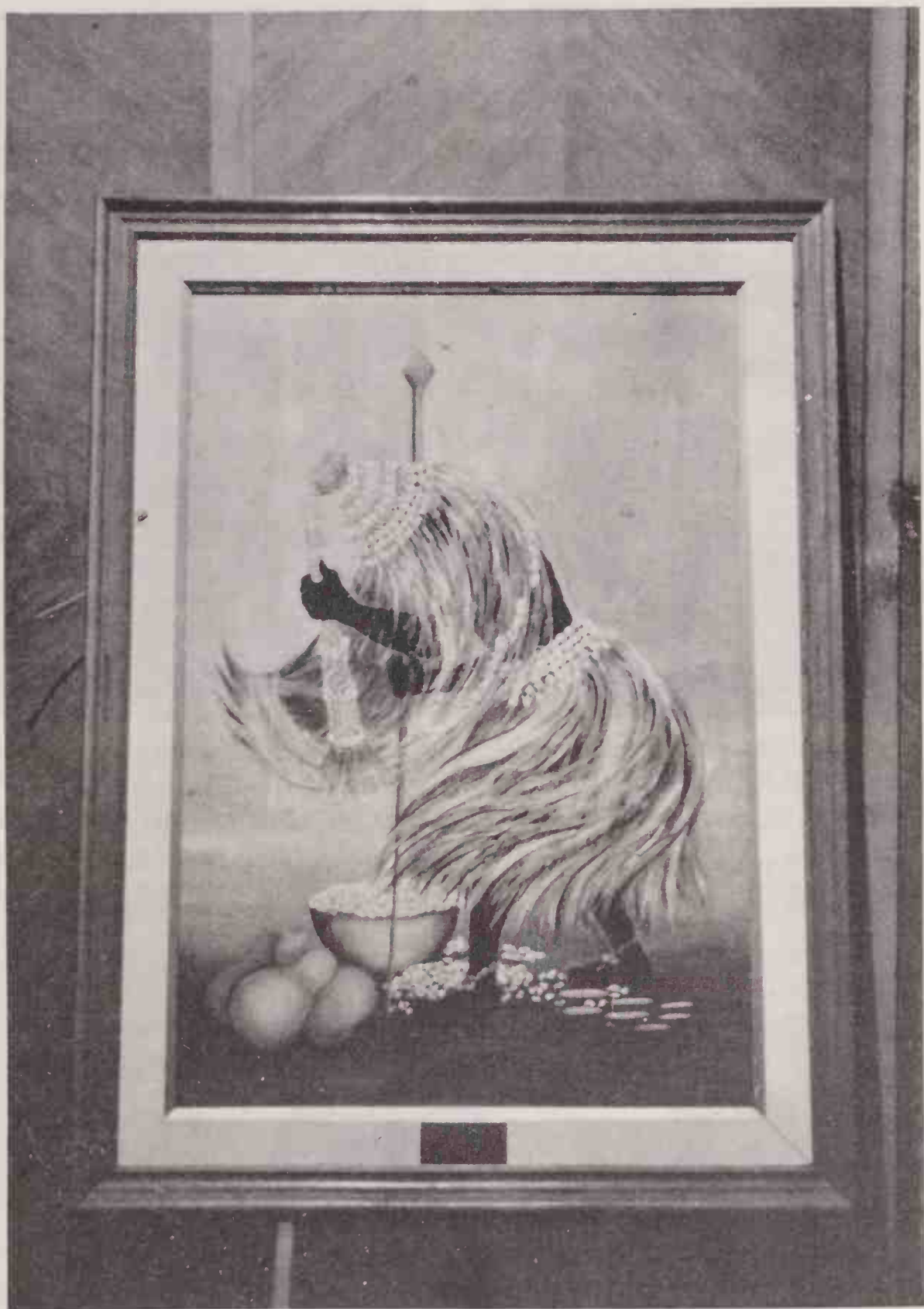
Quadro de Obaluaíê, orixá admirado pelo professor devido a seus vínculos míticos com Ossãe.