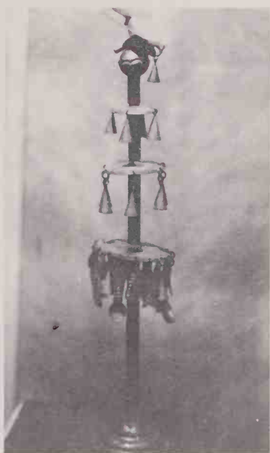
Opaxorô (60 cm), cetro de Oxalá. Com ele, ainda criança, foi iniciado o professor.