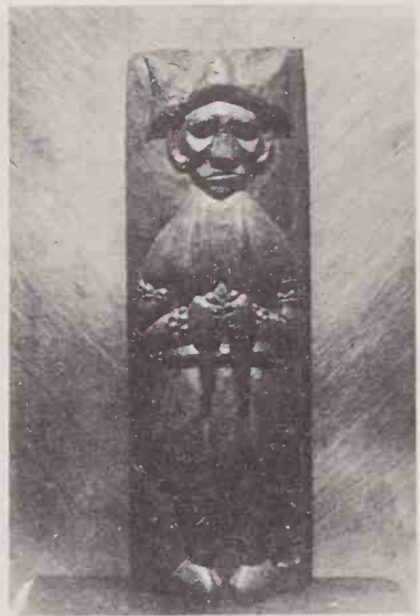
Figura de Xangô, esculpida por Manuel Bonfim.