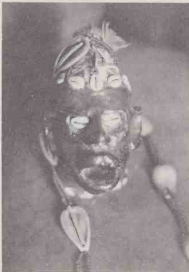
Exu de Ifá, originário do Benin (antigo Daomé).