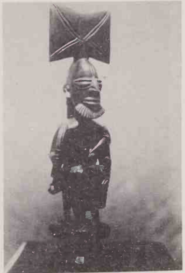
Estatueta de Xangô, procedente da Nigéria.