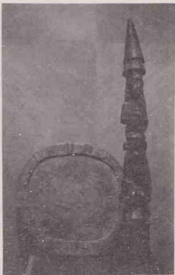
Oponifá, tábua usada no jogo de Ifá, e Ifá Irokê, instrumento de invocação deste orixá.