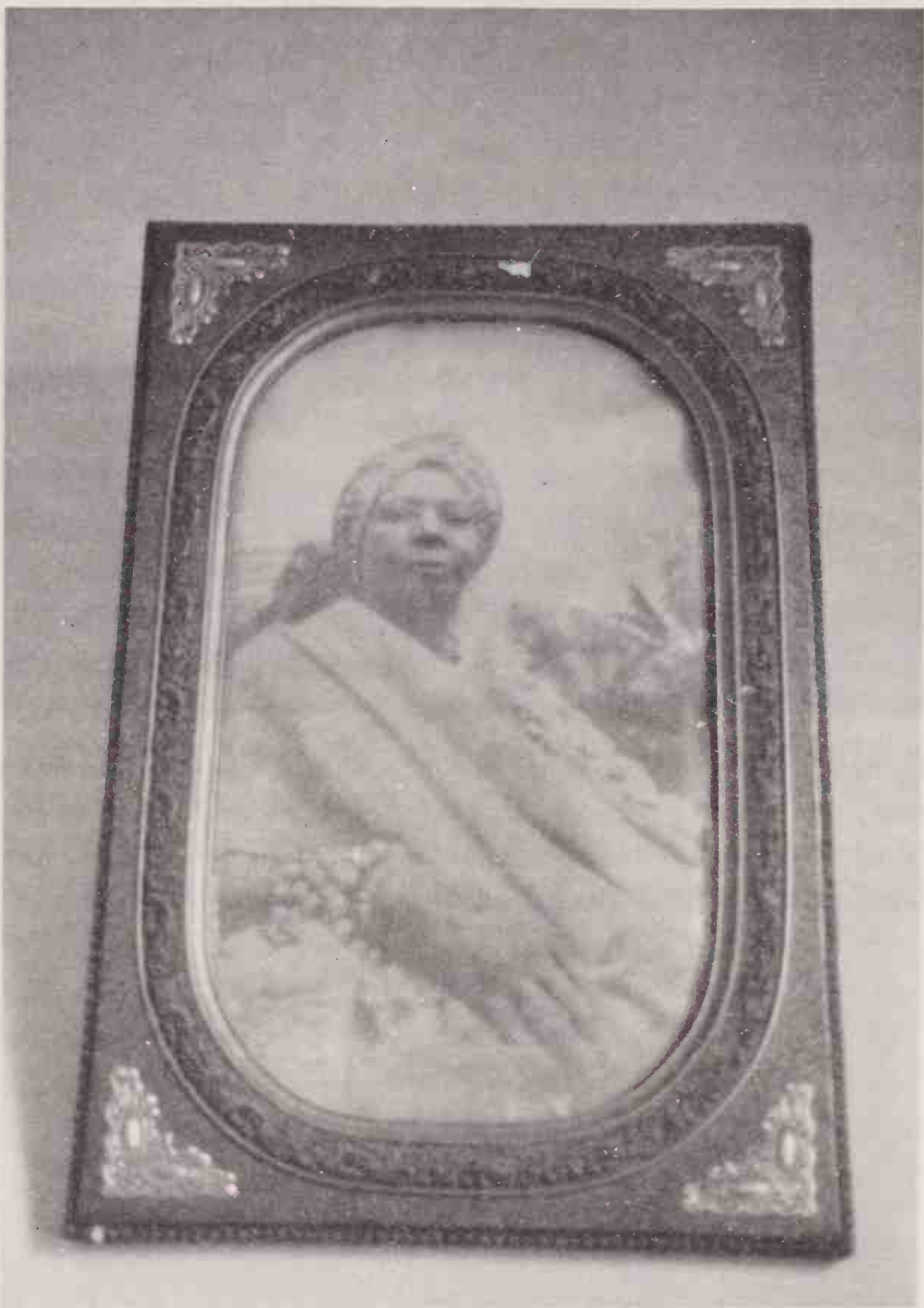
Fotografia de mãe Aninha, Obá Biyi, dependurada na parede do quarto de jogo.