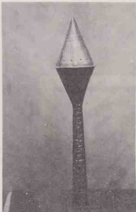
Xere, chocalho ritual empunhado apenas por dignitários do culto a Xangô.