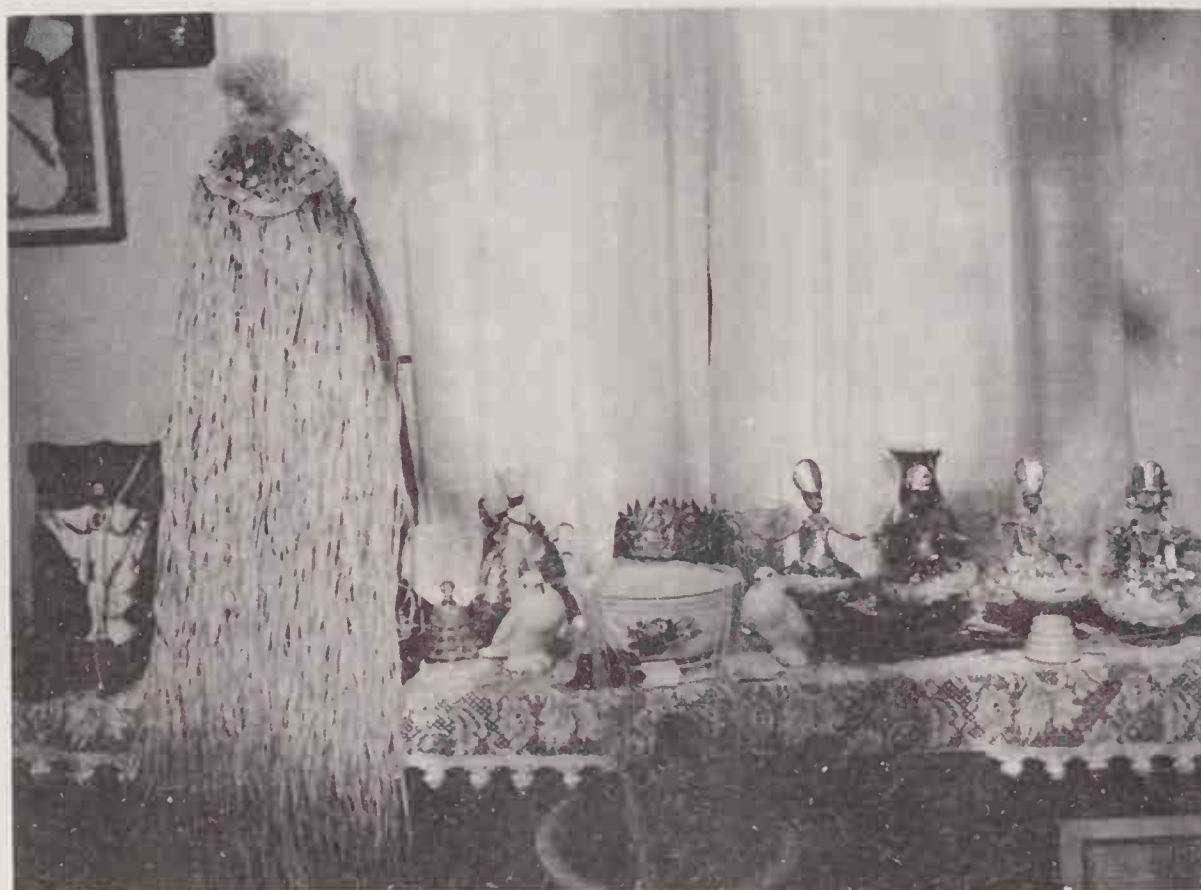
Quarto em que o professor cultua os orixás.