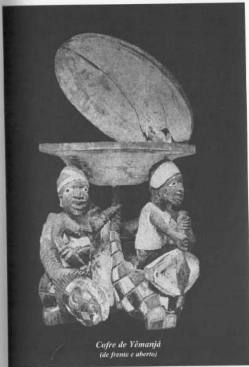
Cofre de Yemanjá (de frente e aberto)