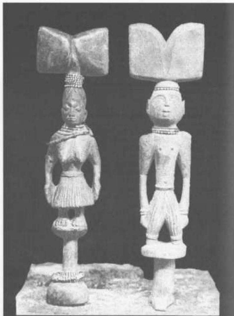
Ochêr de Chango