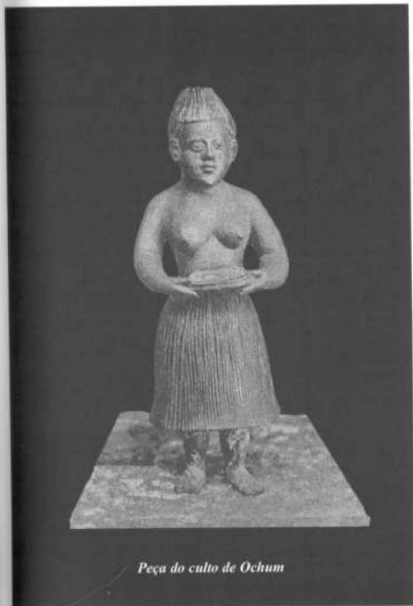
Peça do culto de Ochum