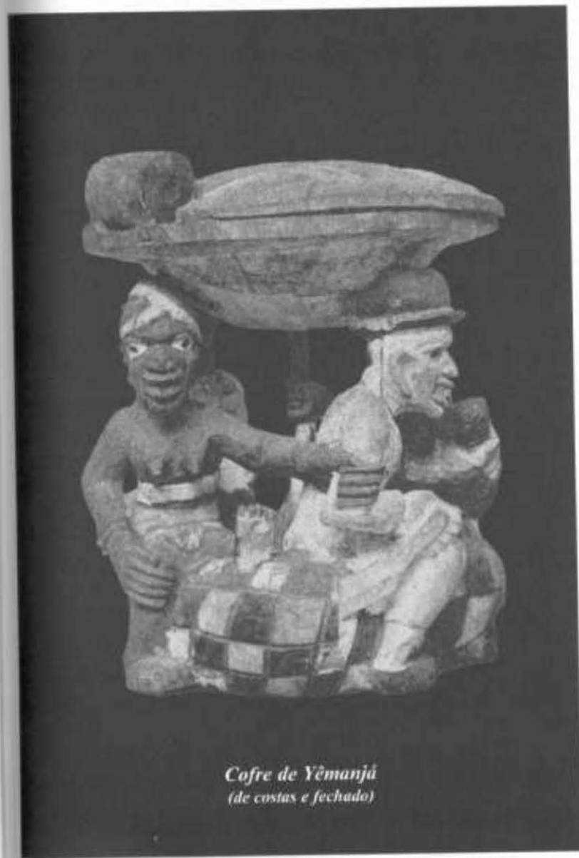
Cofre de Yemanjá (de costas e fechado)