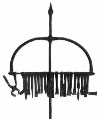
Ferramenta de Ogum