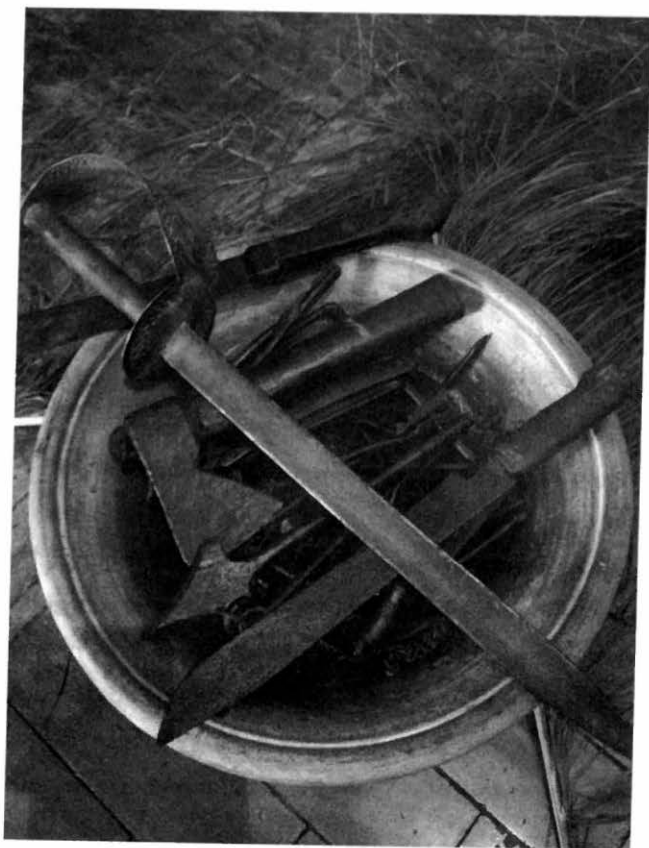
Assentamento de Ogum

Os iniciados para Ogum usam vestimentas de cor azul-escura e, às vezes, vermelha ou verde. Quando se trata da qualidade Ogunjá, a cor preferencial é o branco. O filho usa colares de contas na cor azul-escura ou, dependendo da qualidade, verde. Quando em transe, os filhos de Ogum exibem uma espada e um feixe de mariô, que também pode estar preso no peito em diagonal. Podem levar na mão, também, uma folha de dracena (peregum), que é a folha específica de Ogum. Na cabeça, usam o acorô, uma coroa em formato de diadema, ou então um capacete próprio dos guerreiros.