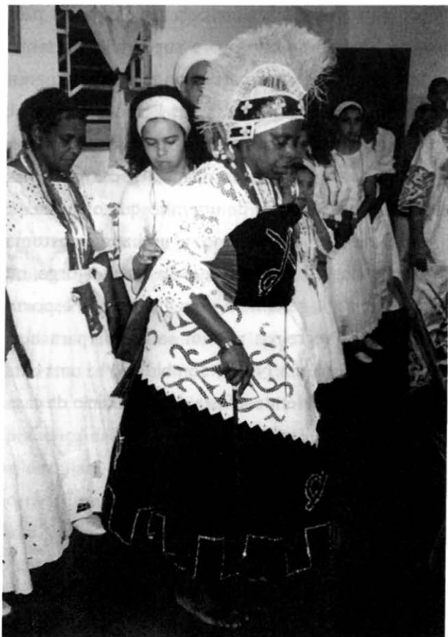
Ogum paramentado