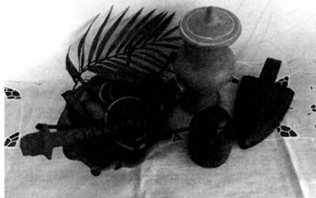
Assentamento de Ogum

assentamento de Ogum, representam uma afronta ao orixá e esse é um de seus maiores tabus (euós). Em dias de preparo das oferendas, também não se deve assobiar no terreiro nem amolar facas e outros objetos cortantes.